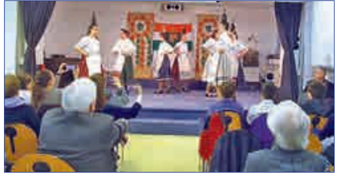
Somogyi üveges tánc

A Frankfurtnban és vonzáskörzetében végzett magyar közösség-szervezői munka pedig példaértékű. Persze, vannak hiányosságok, mint mindenhol, de az összetartó erőt mi sem bizonyítja jobban, mint a városban immáron 51 éve működő 84. sz. Lehel Vezér Cserkészcsapat vagy az ugyancsak frankfurti Cifra Gyermek- és Ifjúsági Táncsportegyesület csoportjai. Előbbiek vezetői az ünnepi alkalomra cserkészegyenruhában jelentek meg, valamint cserkészekkel gyönyörű fali kokárda dekorációt készí-