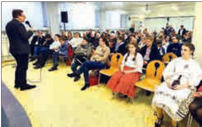
Vincze Loránt parlamenti képviselő