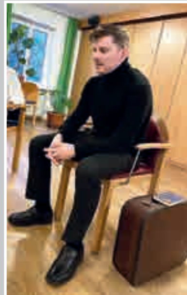
József Attila - Mucha Oszkár